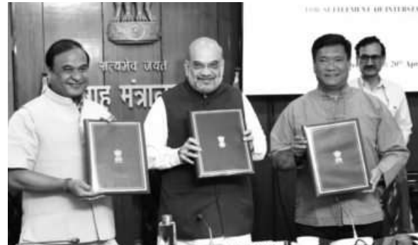
(From left) Assam Chief Minister Himanta Biswa Sarma, Union Home Minister Amit Shah, and Arunachal Pradesh CM Pema Khandu, in New Delhi on Thursday

Assam and Arunachal Pradesh share an 804.1-km-long border. The two states have been in discussions to resolve the border dispute with Sarma and Khandu signing the Namsai Declaration on July 15 last year wherein they had pledged to find a solution